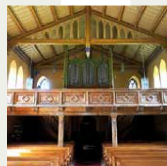
Dorfkirche Brodwin